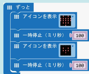
点滅するハートのプログラム

micro:bit は、イギリス BBC が中心となって、教育用として開発された小型コンピューターです。